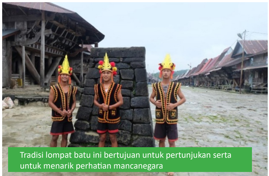
Tradisi lompat batu ini bertujuan untuk pertunjukan serta untuk menarik perhatian mancanegara

lah anak/keturunan sedangkan Niha adalah manusia, dan pulau nias dinamakan “Tano Niha” yang artinya Tano adalah tanah sedangkan Niha adalah manusia. Suku nias merupakan suku yang hidup dalam lingkungan adat dan kebudayaan yang tinggi hingga sekarang. Hukum adat nias disebut “Fondrako” yang mengatur segala segi kehidupan sampai kematian. Pulau nias adalah pulau yang terletak di sebelah barat Sumatera yang