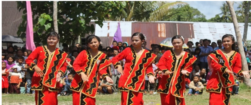
tarian khas dari suku nias, tarian ini sering ditunjukkan pada saat acara pesta pernikahan

Tarian ini merupakan tarian khas dari suku nias, tarian ini sering ditunjukkan pada saat acara pesta pernikahan maena biasanya dilakukan dalam acara perkawinan (fangowalu), pesta (falōwa), bahkan ada maena Golkar pada pemilu tahun 1971, menandakan betapa tari maena sudah membudaya dan fleksibel, bisa diadakan da-