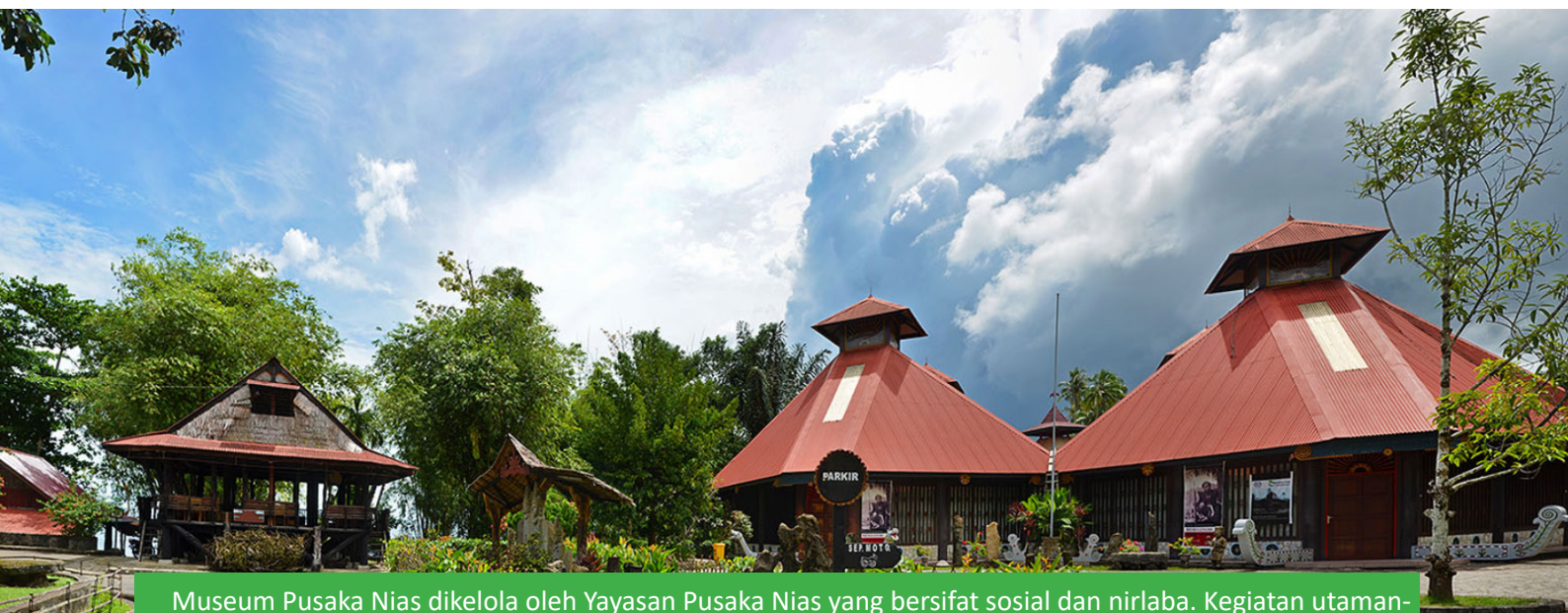
Museum Pusaka Nias dikelola oleh Yayasan Pusaka Nias yang bersifat sosial dan nirlaba. Kegiatan utamanya berfokus pada pelestarian budaya Nias. Yayasan Pusaka Nias didirikan oleh Pastor Johannes Hammerle yang telah bekerja di Nias sejak tahun 1971

Kita lihat perkembangan kultur lokal pada masa kini, Sejarah perkembangan kearifan lokal telah menorehkan catatan penting bahwa kebijakan berperan penting dalam membangun kemasyarakatan. Oleh karenanya kearifan lokal sudah seharusnya dijaga dan dilestarikan oleh segenap bangsa dan negara baik seseorang maupun kelompok masyarakat tertentu. Dengan demikian maka akan berlangsungnya penerapan atau